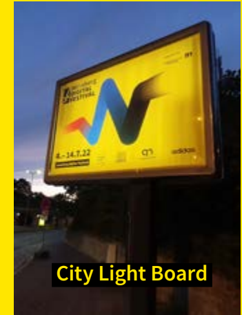
City Light Board