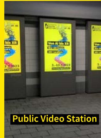
Public Video Station