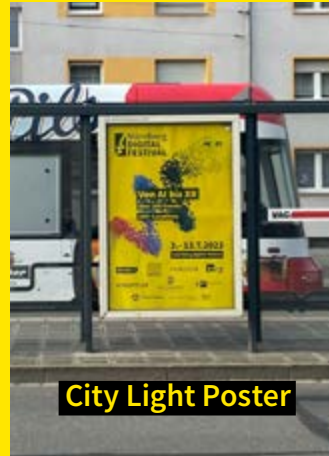
City Light Poster